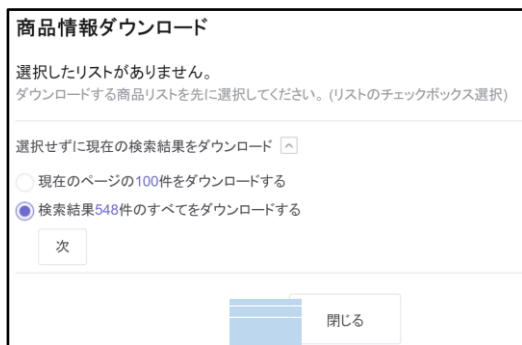
《商品情報ダウンロード》